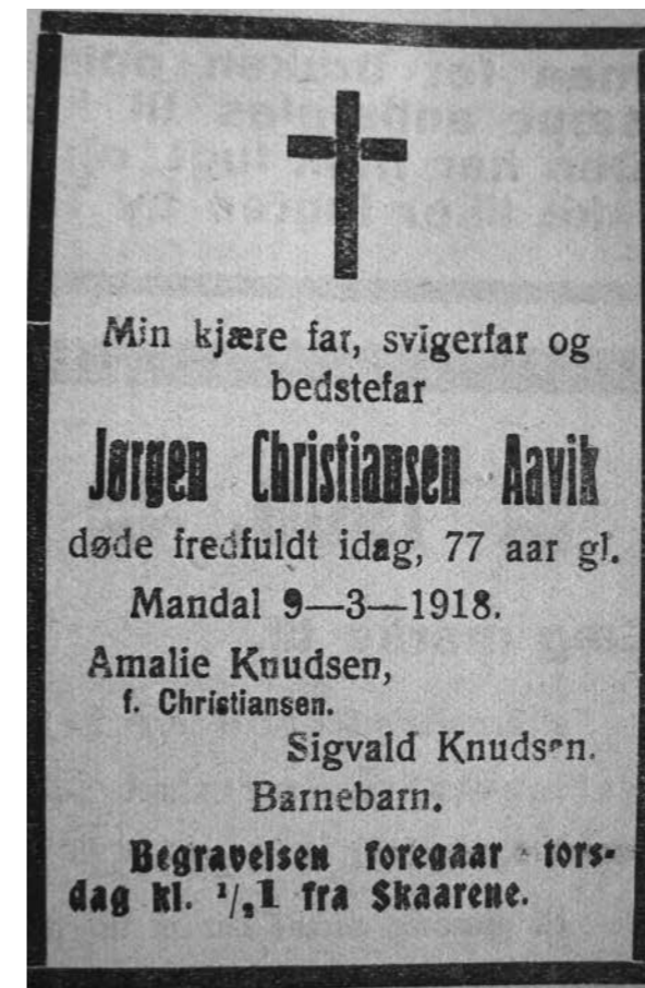
Dødsannonse fra avisen Lindesnes 13. mars 1918.