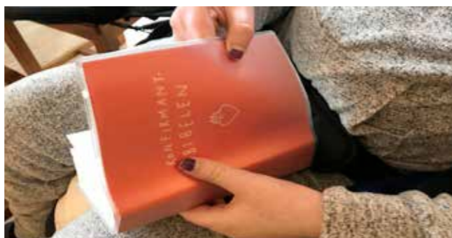
Arbeidsboka til våre konfirmanter.