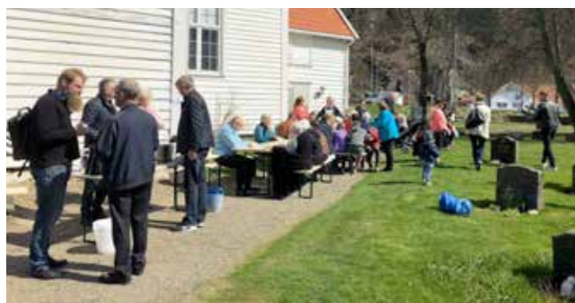
Servering av lapskaus utenfor Valle kirke.